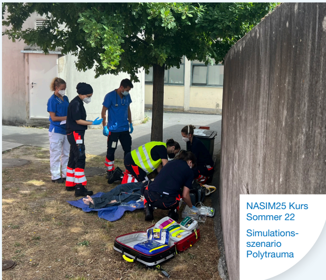
NASIM25 Kurs Sommer 22 Simulations- szenario Polytrauma

Wir freuen uns Sie bei unseren Kursen begrüßen zu dürfen.