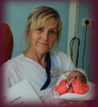
Stillberatung auf Station